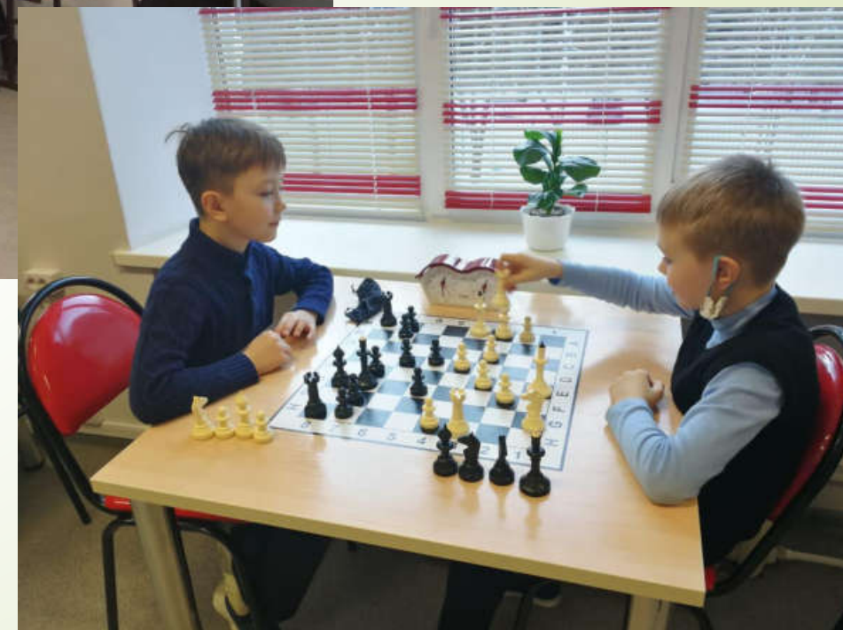
«Шахматный кружок» для учащихся начальной школы